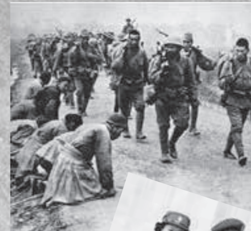
Der Chinesische-Japanische Krieg zerstört alle Hoffnungen, dass Fongs Familie je wieder zusammenkommt. Als sich im Zweiten Weltkrieg in Kanada lebende Chinesen freiwillig zur Armee melden, beginnt erstmals der anti- chinesische Rassismus zu bröckeln.